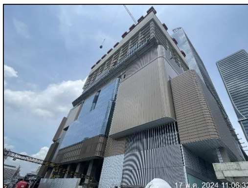
ภาพที่ 1.6-1 สถานภาพการก่อสร้างโครงการในปัจจุบัน